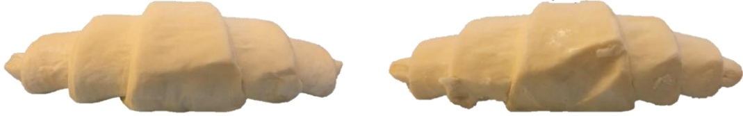
สินค้าบุบ/แบน เล็กน้อย แต่ขนาดอยู่ในข้อกำหนด