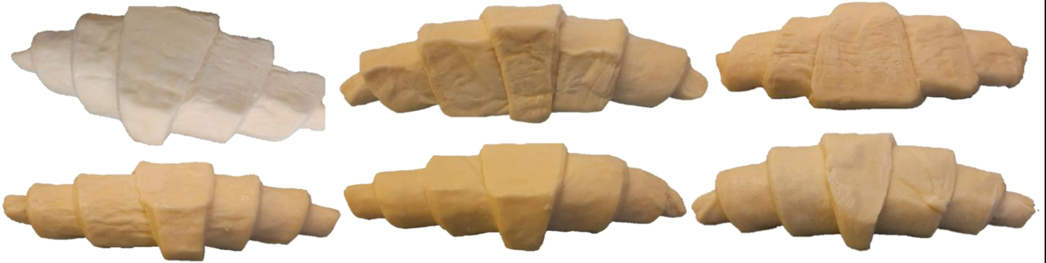
สินค้าบุบ/แบน มากและไม่ได้ขนาดตามข้อกำหนด