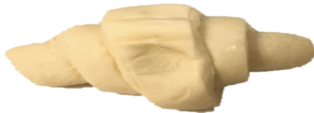
พบรอยบุบ/รอยนิ้วมือลึก