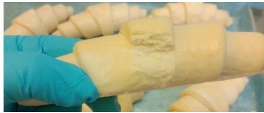
สินค้าแตก/หัก